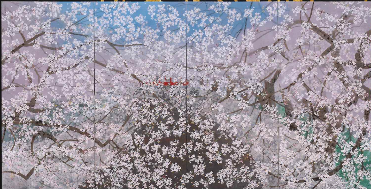
中島千波〈櫻雲の目黒川〉2013年