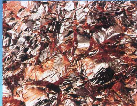
伊奈英次《WASTE: 銅箔、長野県中野市》1996 (平成8) 年、当館蔵