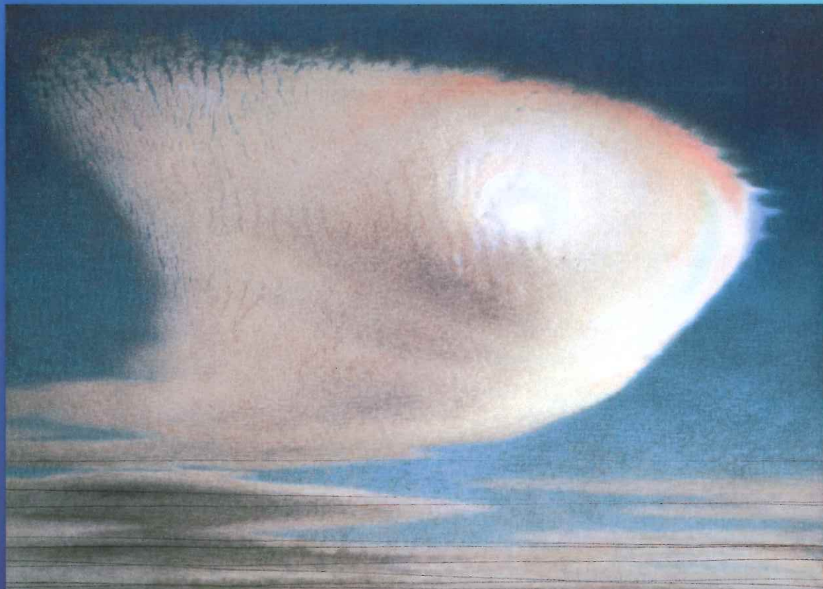
岩橋英達《彩雲》1979（昭和54）年、当館蔵