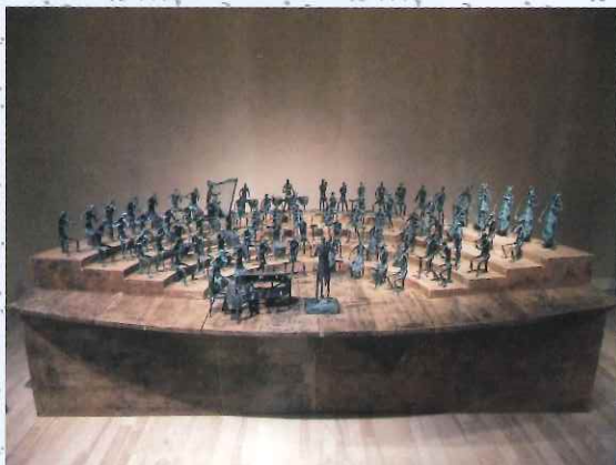
米坂ヒデノリ《頌讃 (三管編成オーケストラ)》1997 (平成9) 年、個人蔵