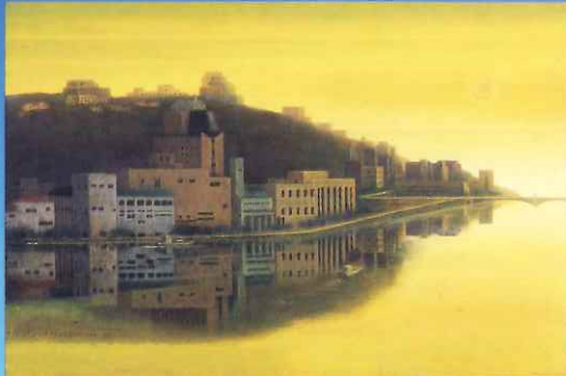
羽山雅倫《黄昏・釧路 (00-3)》2000 (平成12) 年、当館蔵

本展では、当館のコレクション約50点により、現代の美術家たちがそれぞれの場面において「光」をどのようにみつめ、表現しているかを検証します。