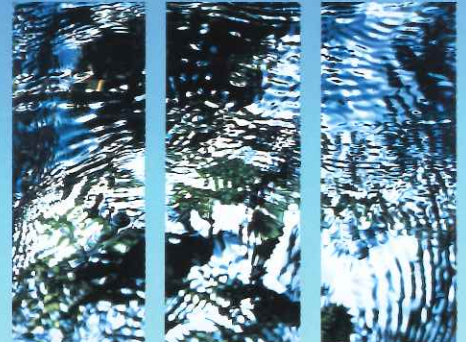
上田薫《流れ S》1997 (平成9) 年、当館蔵