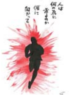
舞台「走る」画コンテ 1997年