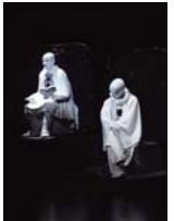
舞台「ノクターン」より 2015年