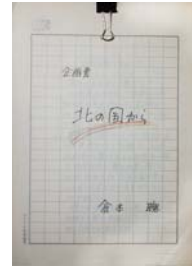
「北の国から」企画書 1981年