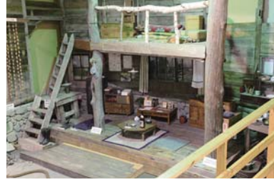
「北の国から」石の家 撮影セット(夜間撮影用) 1995年