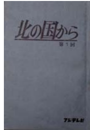
「北の国から」台本 1981年