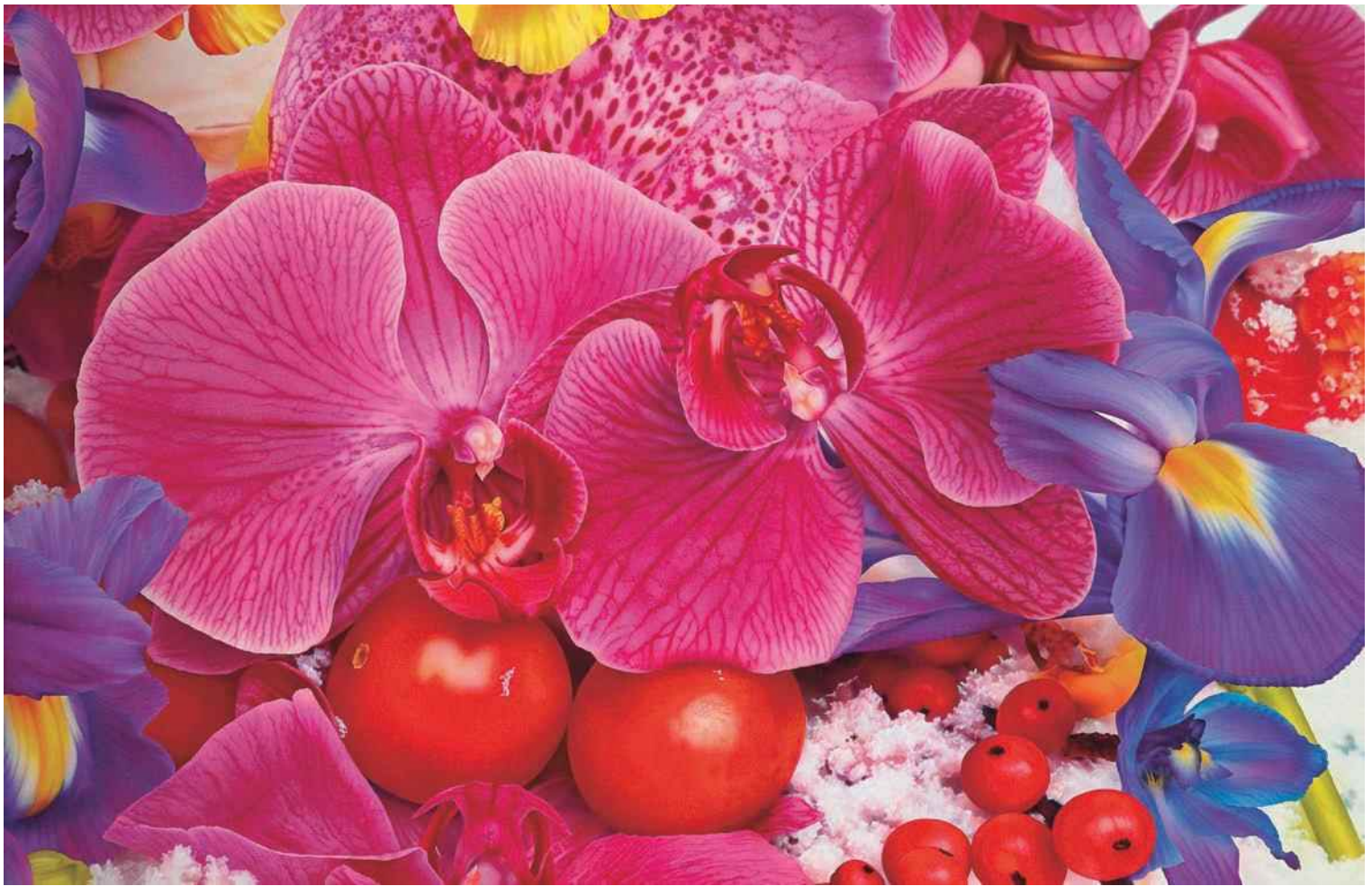
マーク・クイン《世界の始まり》2010年 ©Marc Quinn studio