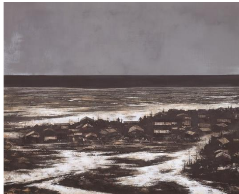
左上：〈北の岬(知床)〉1989(平成元)年 北海道立近代美術館蔵