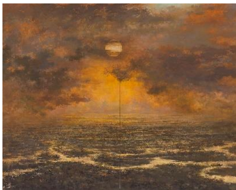
下：〈冬日(悠々釧路湿原)〉2015(平成27)年 北海道立釧路芸術館蔵