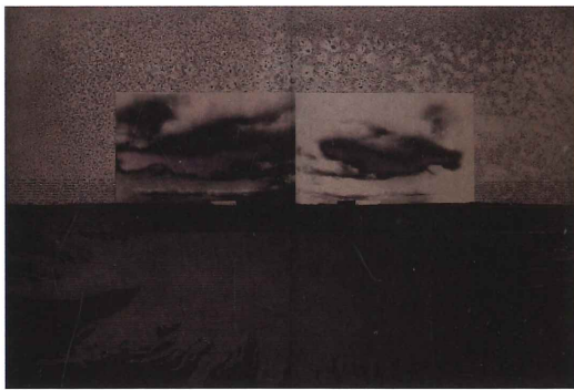
池田良二《Cape watershed (岬の分水嶺)》1988年 当館蔵