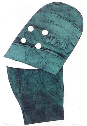
中谷有造(禰)《団長夫人》1984年 北海道立帯広美術館蔵