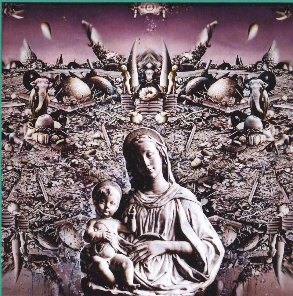
出店 久夫《地と母子像》2010-11年 北海道立帯広美術館蔵

RE-PRO-DUCE Explorations in Print and Photography