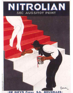
レオネット・カピエロ《速乾ペンキ(ニトロリアン)》 1929年 北海道立帯広美術館蔵