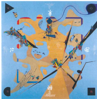
毛網毅曠《建築古事記—曼陀羅3(地)》 1991年 当館蔵