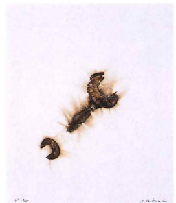
一原徳(タナカ)《光と影》1980年 北海道立帯広美術館蔵