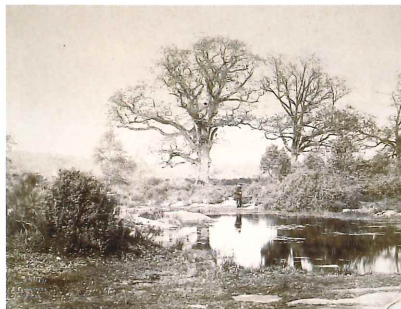
シャルル・ファマン《ダニョーの沼》1874年 北海道立帯広美術館蔵