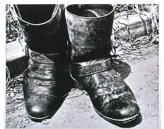
森山大道《「光と影」より：靴》1981年 当館蔵

RE-PRODUCE Explorations in Print and Photography