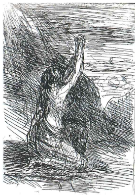
ジャン＝バティスト＝カミュー・コロール 《ひざまずくマグダラのマリア》 1858年 北海道立帯広美術館蔵