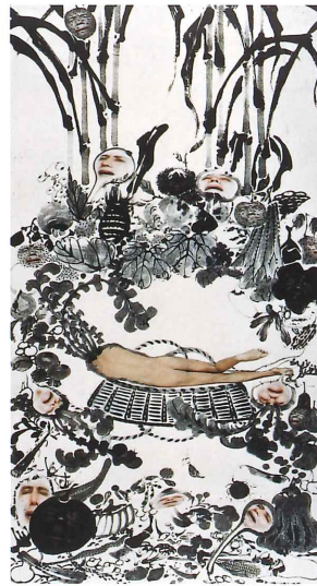
森村泰昌《野菜涅槃(岩沖)》 1990年 北海道立帯広美術館蔵 Copyright the artist, Courtesy of ShugoArts